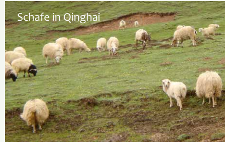
Schafe in Qinghai

Transfer zum Bahnhof; Fahrt mit dem Schnellzug nach Xining; Transfer zum Qinghai-See